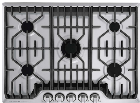
Table de cuisson au gaz de 30 po avec plaque chauffante