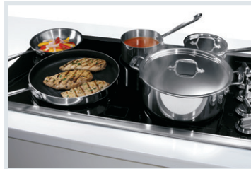
Table de cuisson Fits-More MC

Les éléments variables s'adaptent à vos besoins de cuisson.