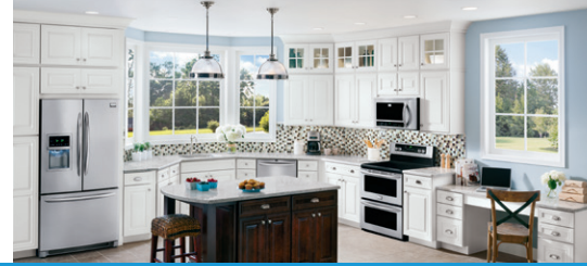
Table de cuisson encastrable