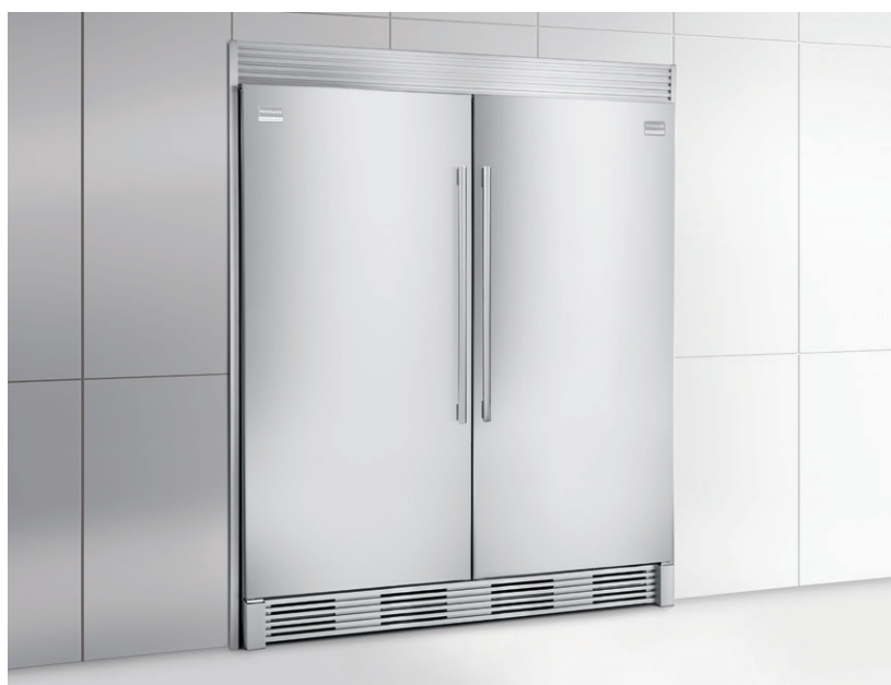
Illustré avec le tout congélateur assorti, modèle FGFU19F6QF, et l'ensemble de garnitures avec longue grille persienne (TRIMKITEZ2) en option.