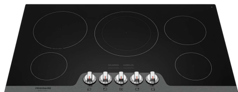
Table de cuisson électrique de 36 po