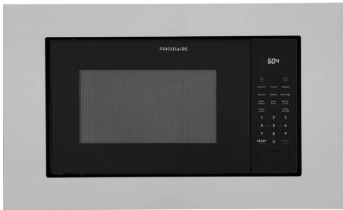
Install Trim Kit Required. Multiple finishes and sizes available.