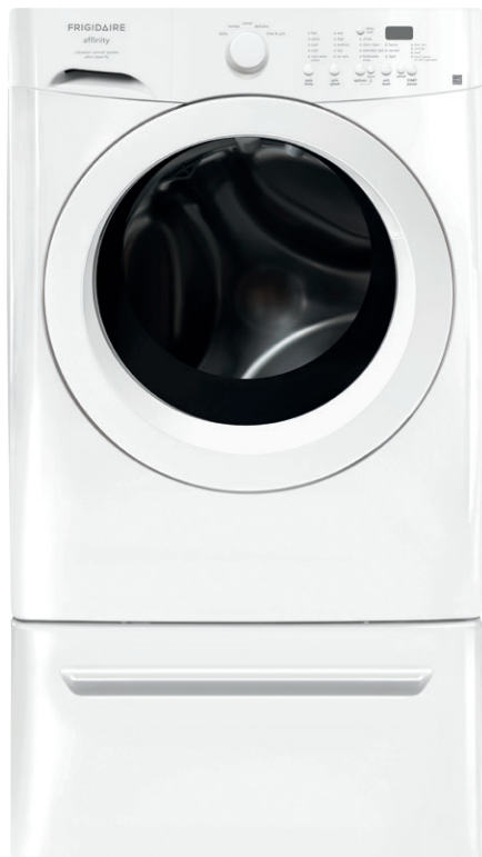
Illustrée avec le tiroir piédestal SpaceWise MD offert en option

Capacité de 3,8 pi 3 (CEI) à 5 cycles de lavage