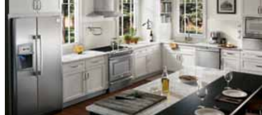
Table de cuisson encastrable FPCC3685KS